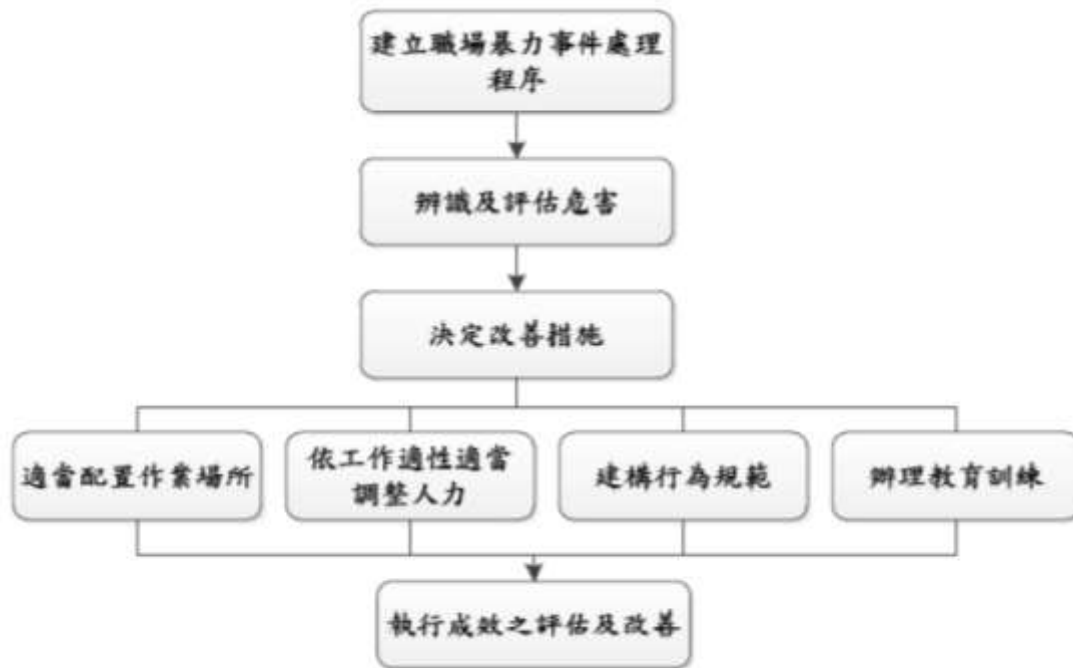
圖 1 執行職務遭受不法侵害預防計畫執行流程