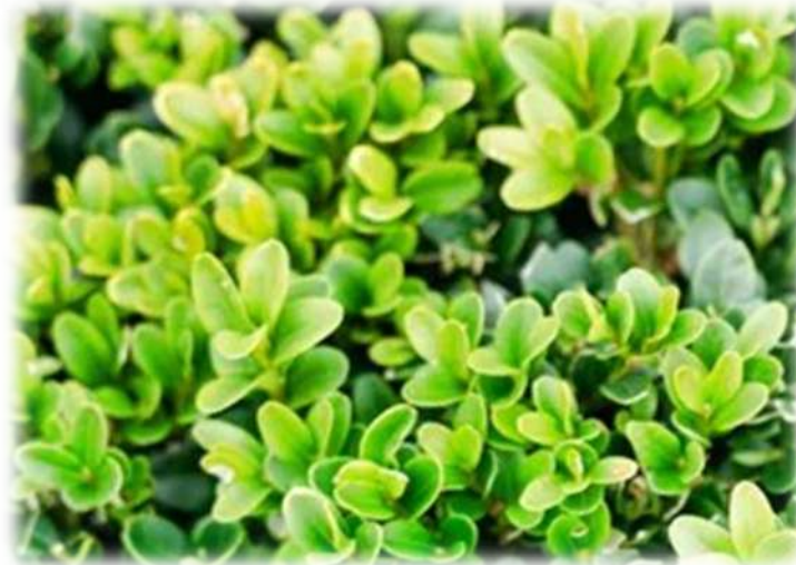
蒴果三子室，熟成褐色，並自動開裂