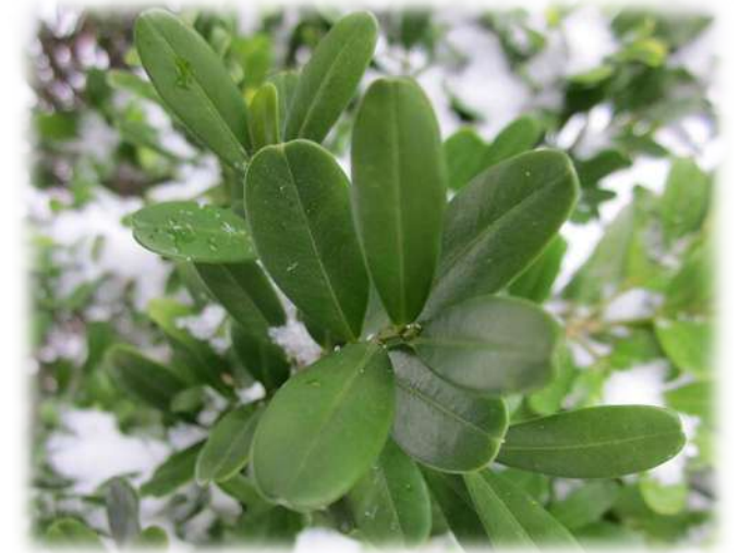
枝條具四稜，光滑無毛，當年生枝條綠色，老枝淺灰褐色